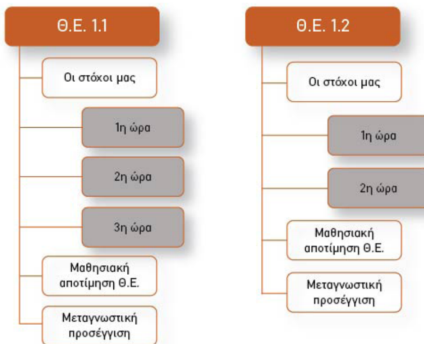
Πίνακας 5. Δομή ωριαίας διδασκαλίας