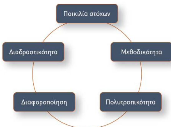
Πίνακας 1. Βασικά χαρακτηριστικά και επιδιώξεις