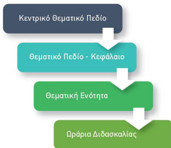
Πίνακας 2. Ιεραρχική διάρθρωση των διδακτικών θεμάτων

Τα θεματικά πεδία των διδακτικών περιεχομένων είναι έξι, τα οποία ορίζει το Πρόγραμμα Σπουδών ως εξής: