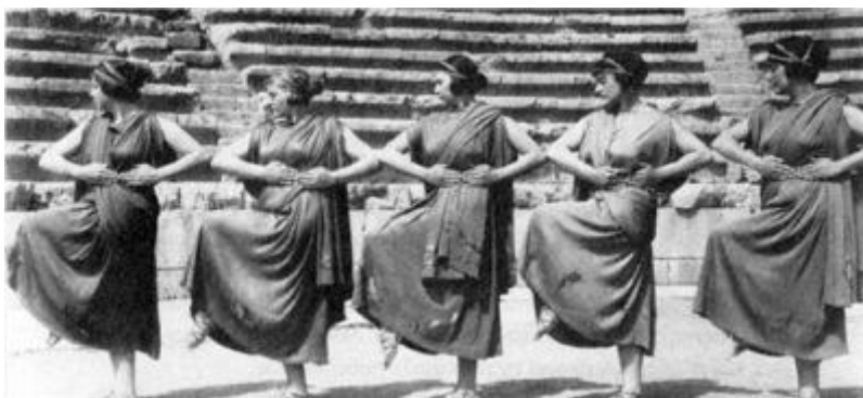
Από τις Δελφικές Γιορτές.

Τομή για την ιστορία της χορογραφίας στις παραστάσεις αρχαίου δράματος θα σταθεί η εργασία της Εύας Πάλμερ-Σικελιανού. Με τη δική της καθοδήγηση ο Χορός στις παραστάσεις των Δελφικών Γιορτών για πρώτη φορά τραγουδάει, χορεύει και αποκτά πρωταγωνιστικό ρόλο. Η εξέλιξη αυτή θα επηρεάσει ριζικά την αντίληψη για το ρόλο του Χορού.