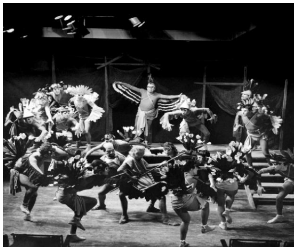
Όρνιθες (1962), Επίδαυρος 1975, σκηνοθεσία Κάρουλου Κουν, κοστούμια Γιάννη Τσαρούχη (Λεύκωμα Κάρουλος Κουν, Μ.Ι.Ε.Τ. 2010).

Στο Θέατρο Τέχνης, αντίθετα, κυριαρχεί εξ αρχής μια διαφορετική αντίληψη. Η χορογραφία δεν ακολουθεί συγκεκριμένα βήματα, σχεδιασμένες συμμετρίες ή σχηματοποιημένες κινήσεις. Η κίνηση προκύπτει μέσα από τον πειραματισμό και τον αυτοσχεδιασμό των ηθοποιών κατά τη διάρκεια της πρόβας. Οι ηθοποιοί είναι ελεύθεροι να αυτοσχεδιάσουν και να προτείνουν οι ίδιοι με τα σώματά τους τον τρόπο κίνησης. Τα λαϊκά δρώμενα γίνονται βασική πηγή έμπνευσης είτε πρόκειται για τραγωδία είτε για κωμωδία. Σε κάθε έργο η προσέγγιση είναι διαφορετική: στους Επτά επί Θήβας ο Χορός θυμίζει λιτανεία, στον Προμηθέα Δεσμώτη η στατικότητα του παραπέμπει σε επιτύμβια στήλη, ενώ στον Οιδίποδα Τύραννο γίνεται σαφής αναφορά σε τοπικό θρησκευτικό δρώμενο της Πάτμου από την ακολουθία της Μεγάλης Πέμπτης.