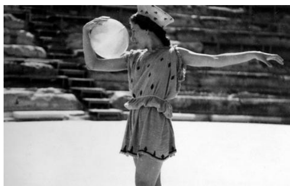
Η Μαρία Χορς, το 1936, στην τελετή αφής της ολυμπιακής φλόγας.

Στις παραστάσεις του Μινωτή ο Χορός κινείται σε ελεύθερες συνθέσεις που οργανώνονται ανά ομάδες ατόμων σε ένα ενιαίο σύνολο. Με τον Μινωτή συνεργάζεται επί σειρά ετών η Μαρία Χορς, μόνιμη χορογράφος του Εθνικού Θεάτρου για περισσότερο από τριάντα χρόνια. Στο διάστημα αυτό δημιουργεί χορογραφίες για όλα τα σωζόμενα έργα του Αισχύλου και για τις περισσότερες από τις τραγωδίες του Σοφοκλή και του Ευριπίδη. Πολλές τραγωδίες, μάλιστα, τις χορογραφεί δύο και τρεις φορές με διαφορετικούς συνήθως τρόπους και συνεργάτες. Στόχος της δεν είναι ο νεωτερισμός, αλλά ο σεβασμός στο αρχαίο κείμενο. Οι δημιουργίες της γεννιούνται μέσα από έναν συνεχή διάλογο με την ίδια την τραγωδία.