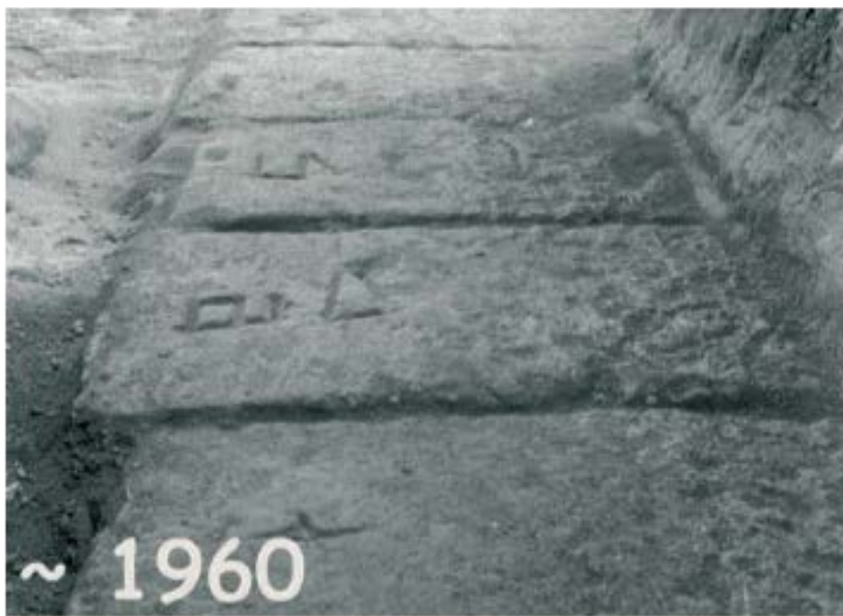
Εικόνα 2. Ένα ενδιαφέρον χαρακτηριστικό του Δίολκου, τα χαραγμένα γράμματα που εμφανίζονται με αυξανόμενη συχνότητα κοντά στο δυτικό του τερματικό, το οποίο σήμερα βρίσκεται μέσα στη θάλασσα (Φωτογραφία από το αρχείο της Εν Αθήναις Αρχαιολογικής Εταιρείας που τραβήχτηκε κατά τις ανασκαφές του 1960). (Πηγή: Σ. Λοβέρδου).