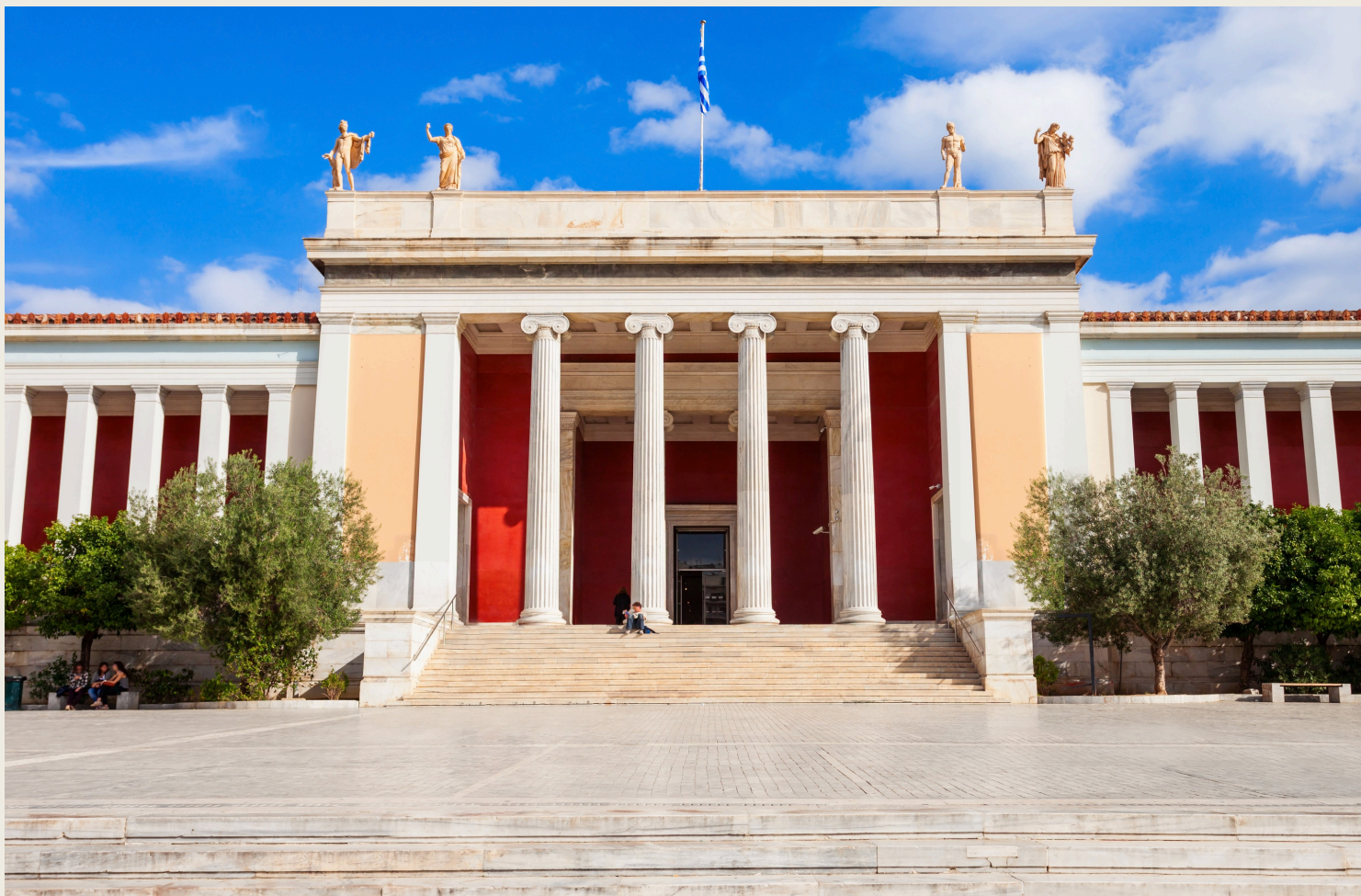
Εικόνα 5 Εθνικό Αρχαιολογικό Μουσείο

Διεύθυνση: 28ης Οκτωβρίου (Πατησίων) 44, Αθήνα