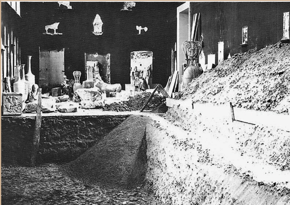
Εικόνα 3 Ορθογώνιος λάκκος για την απόκρυψη γλυπτών στην αίθουσα των Κλασικών Επιταμβίων.