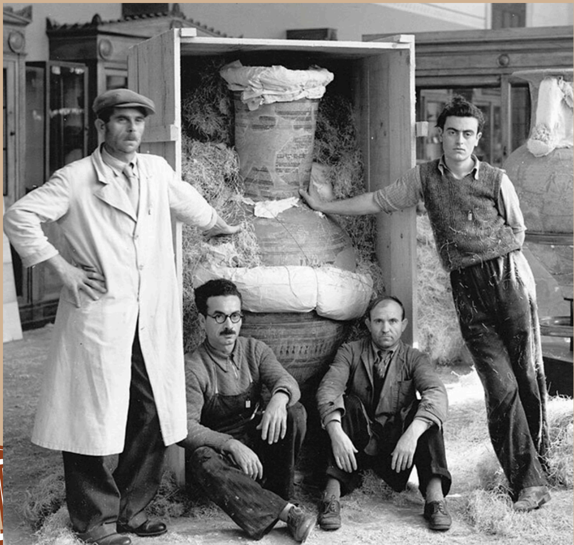
Εικόνα 2 Προετοιμασία του γεωμετρικού αμφορέα των χρόνων γύρω στο 760-750 π.Χ., από το Δίπυλο της Αθήνας προς απόκρυψη.