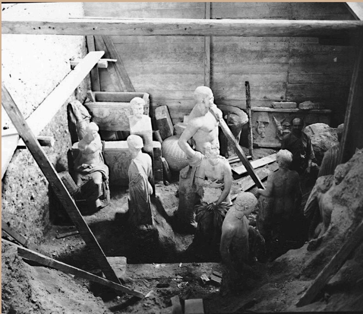
Εικόνα 4 Απόκρυψη μαρμάρινων γλυπτών σε λάκκο σε αίθουσα του Μουσείου