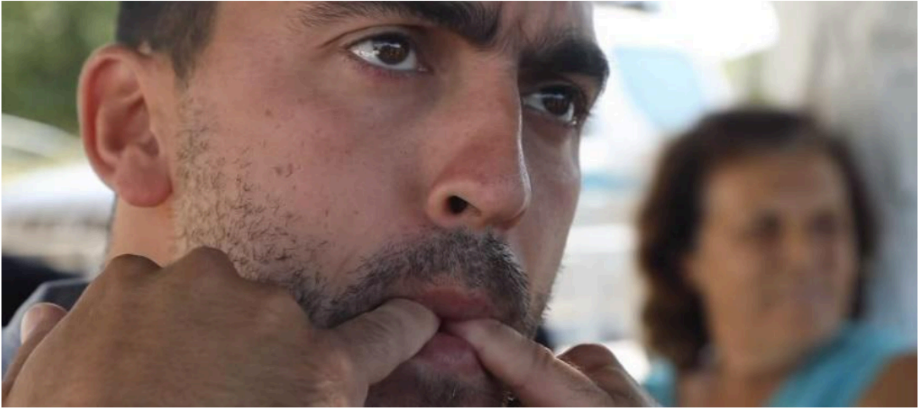
Στιγμιότυπο από βίντεο του PBS News Hour

Μια ιδιαίτερη γλώσσα που κινδυνεύει να εξαφανιστεί.