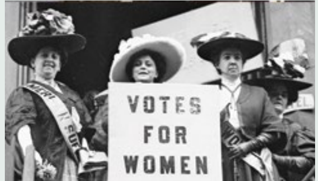
Γυναίκες κερδίζουν το δικαίωμα ψήφου (τέλη 19ου - αρχές 20ού αιώνα)

Στα τέλη του 19ου και στις αρχές του 20ού αιώνα, οι γυναίκες σε πολλές χώρες αγωνίστηκαν για να αποκτήσουν το δικαίωμα ψήφου. Αυτό το κίνημα, γνωστό ως γυναικείο κίνημα ή κίνημα της σουφραζέτας, ήταν σημαντικό γιατί διεκδίκησε ίσα δικαιώματα για τις γυναίκες και τη δυνατότητα να συμμετέχουν στη δημοκρατία.