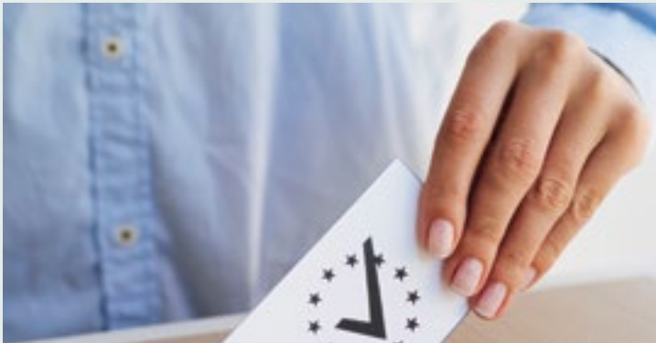
Σύγχρονες εκλογές (21ος αιώνας)

Σήμερα, οι πολίτες συμμετέχουν στις εκλογές για να ψηφίσουν τους αντιπροσώπους τους και να εκφράσουν τη γνώμη τους για σημαντικά ζητήματα. Οι εκλογές είναι μια βασική διαδικασία της δημοκρατίας που επιτρέπει στους ανθρώπους να έχουν φωνή στη διακυβέρνηση της χώρας τους.