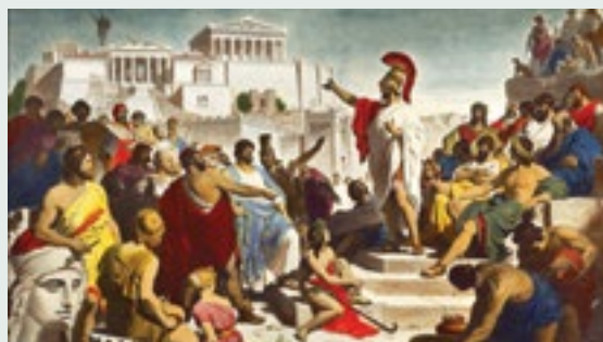
Αρχαία Αθήνα - Περικλής (5ος αιώνας π.Χ.)

Η δημοκρατία γεννήθηκε στην Αρχαία Ελλάδα. Ο Περικλής, ένας σπουδαίος ηγέτης της αρχαίας Αθήνας, μιλάει στη συνέλευση των Αθηναίων. Όλοι οι πολίτες συμμετείχαν στις αποφάσεις.