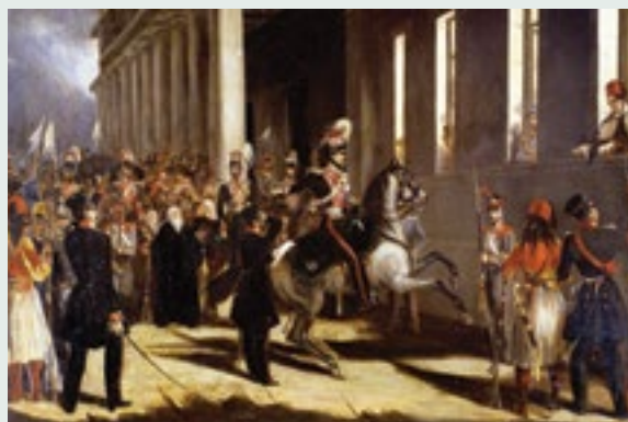
Ελληνικό Σύνταγμα του 1844

Μετά την Ελληνική Επανάσταση του 1821 εναντίον των Οθωμανών Τούρκων, οι Έλληνες πέτυχαν την ανεξαρτησία τους. Το 1844, οι Έλληνες απαίτησαν και κέρδισαν το πρώτο τους Σύνταγμα από τον βασιλιά Όθωνα. Το Σύνταγμα του 1844 αποτέλεσε ένα σημαντικό βήμα προς τη δημιουργία ενός δημοκρατικού κράτους, στο οποίο οι πολίτες έχουν δικαιώματα και συμμετέχουν στη διακυβέρνηση της χώρας.