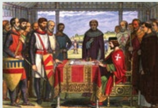
Υπογραφή της Magna Carta (1215)

Το 1215, ο βασιλιάς Ιωάννης της Αγγλίας αναγκάστηκε να υπογράψει τη Magna Carta, ένα έγγραφο που περιόριζε την εξουσία του και έδινε περισσότερα δικαιώματα στους ευγενείς και τους πολίτες. Ήταν ένα σημαντικό βήμα προς τη δημιουργία των σύγχρονων δημοκρατιών, γιατί εισήγαγε την ιδέα ότι ο βασιλιάς έπρεπε να ακολουθεί τον νόμο και ότι οι πολίτες είχαν δικαιώματα που έπρεπε να προστατεύονται.