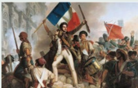
Γαλλική Επανάσταση (1789)

Στις 4 Ιουλίου 1776, οι Ηνωμένες Πολιτείες της Αμερικής ανακήρυξαν την ανεξαρτησία τους από τη Μεγάλη Βρετανία με τη Διακήρυξη της Ανεξαρτησίας, ένα σημαντικό έγγραφο που τονίζει τα δικαιώματα και τις ελευθερίες των ανθρώπων.