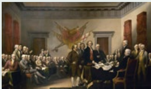
Αμερικανική Επανάσταση - Διακήρυξη της Ανεξαρτησίας (1776)

Στις 4 Ιουλίου 1776, οι Ηνωμένες Πολιτείες της Αμερικής ανακήρυξαν την ανεξαρτησία τους από τη Μεγάλη Βρετανία με τη Διακήρυξη της Ανεξαρτησίας, ένα σημαντικό έγγραφο που τονίζει τα δικαιώματα και τις ελευθερίες των ανθρώπων.