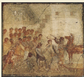
Η μαντεία της Κασσάνδρας: Τοιχογραφία από την οικία του Μενάνδρου στην Πομπηία

Προσπάθησε να εντοπίσεις και να γράψεις στη δεξιά στήλη τα τρία σημαντικά γεγονότα από τη ζωή της Κασσάνδρας που εικονίζονται στα έργα τέχνης της αρχαιότητας (αριστερή στήλη).