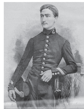
Εικόνα 2 Sadi Carnot (1796-1832)