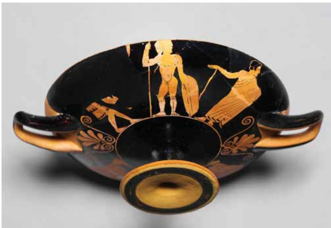
Κύλικας που απεικονίζει πολεμιστές πριν από τη μάχη, περ. μέσα 5ου αι. π.Χ., Μητροπολιτικό Μουσείο της Νέας Υόρκης