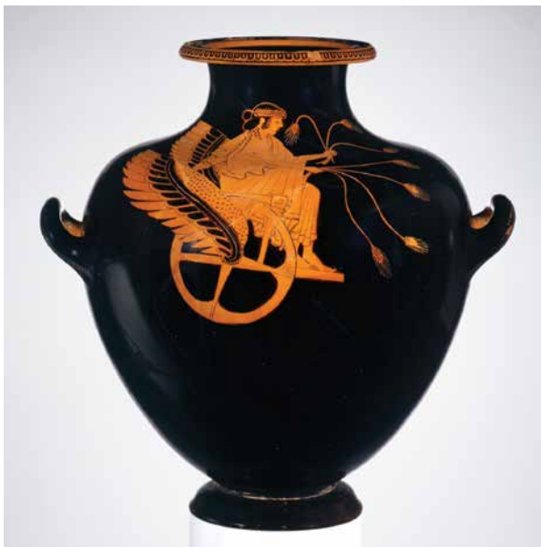
Αττική υδρία, περ. 490 π.Χ. που απεικονίζει τον Τριπτόλεμο, μυθικό πρίγκιπα της Ελευσίνας, Μητροπολιτικό Μουσείο της Νέας Υόρκης

Θα επιβεβαιωθεί άραγε ο κακός οιωνός της επιστροφής του Αλκιβιάδη ανήμερα των «Πλυντηρίων»;