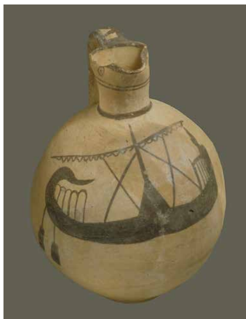
Κυριακή υδρία, περ. μέσα 7ου αι. π.Χ. που απεικονίζει πλοίο, Μητροπολιτικό Μουσείο της Νέας Υόρκης

Από «ήγεμών - αυτοκράτωρ» ο Αλκιβιάδης, εξόριστος στη Σηστό και αντιμέτωπος με την πλήρη απαξίωση.