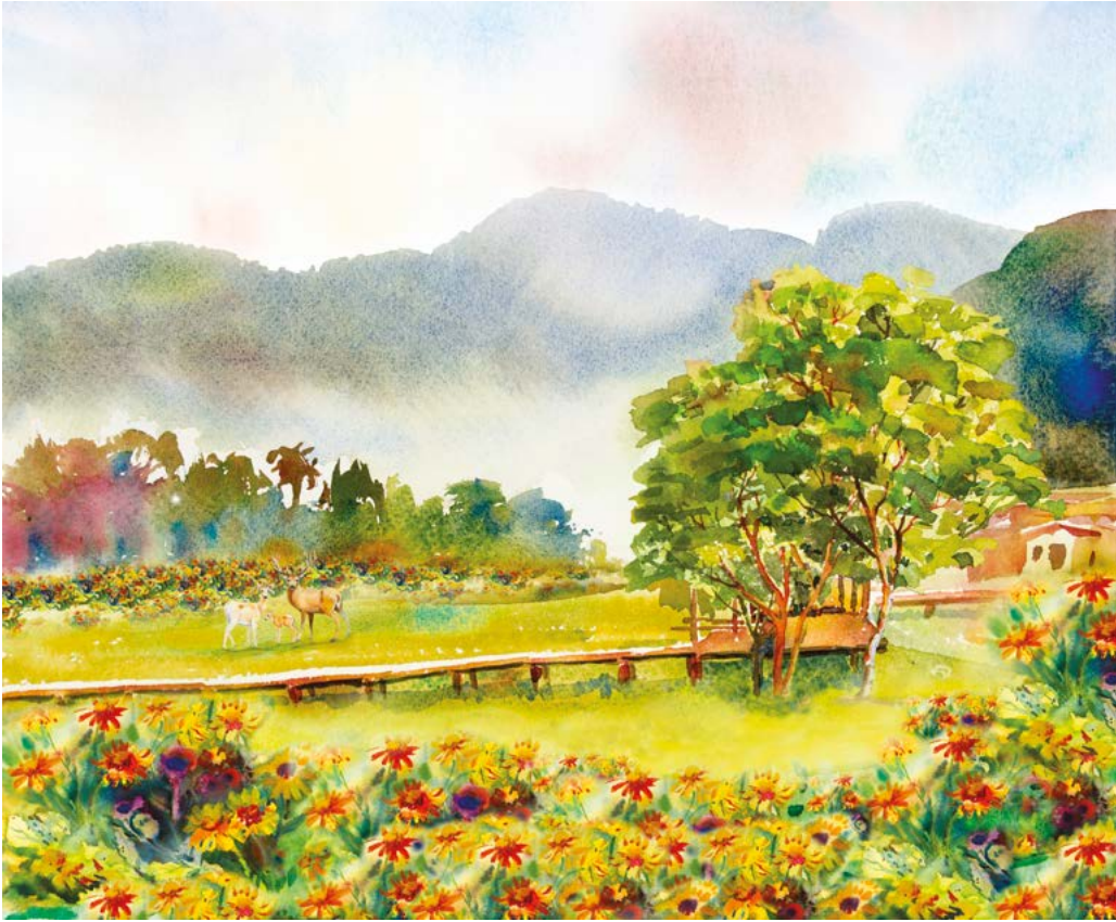
Εικόνα 1. Πίνακας ζωγραφικής που έχει ολοκληρωθεί με πινέλα και φυσικά χρώματα πάνω σε καμβά.