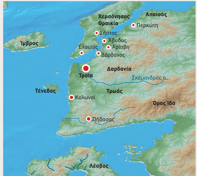
Η δέση της Τροίας