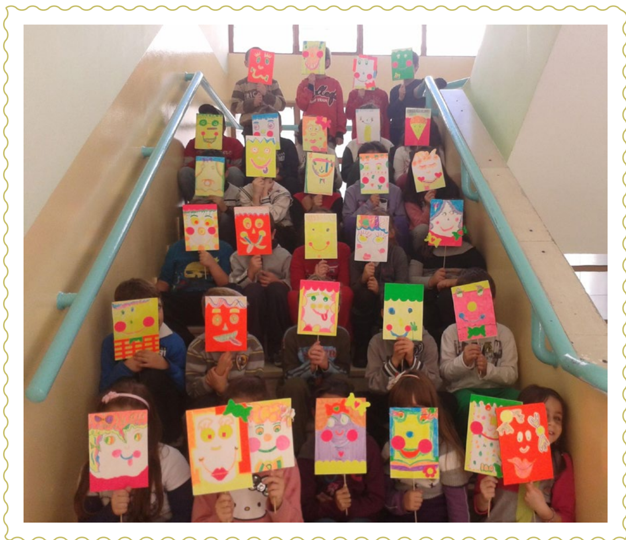
Β΄ δημοτικού, 8ο Δημοτικό Σχολείο Αθηνών