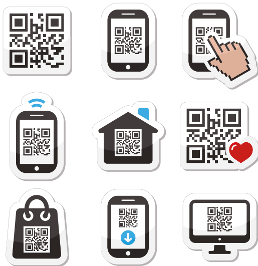
Εικόνα 3. QR-code Τεχνολογία