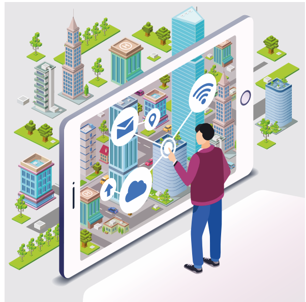
Εικόνα 2. Ευκολία πρόσβασης στις υπηρεσίες από τον πολίτη