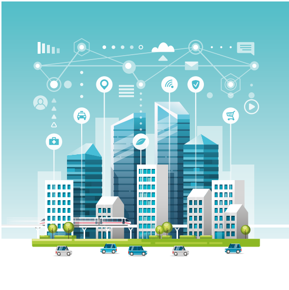
Εικόνα 1. Διασύνδεση όλων των υπηρεσιών