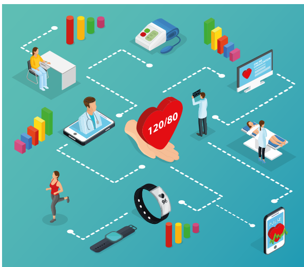
Εφαρμογή συστήματος υγείας