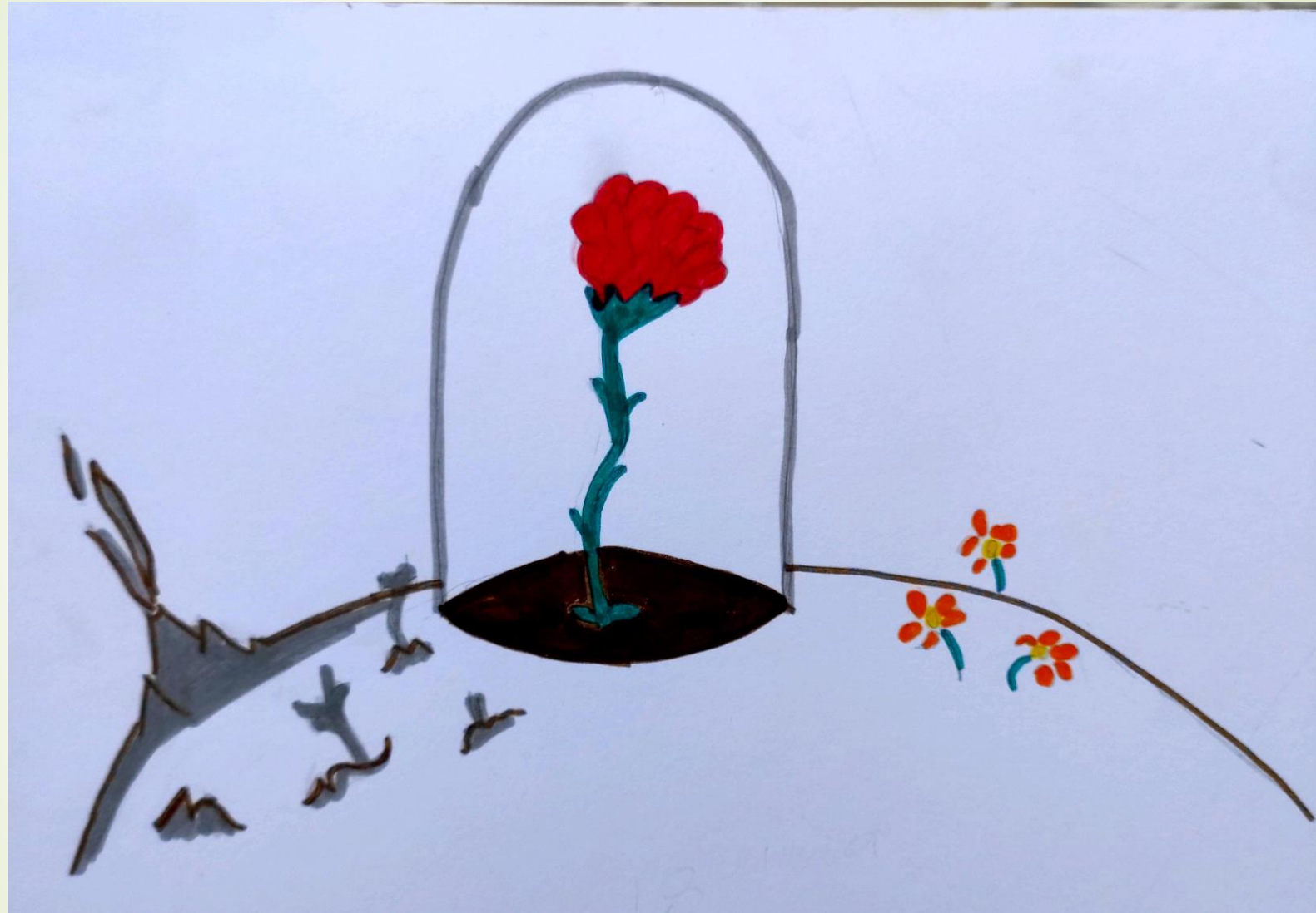
Ζωγραφιά από τη μαθήτριά Στ' τάξης Δημοτικού Σχολείου, Μαρία-Άννα Κανονίδου.