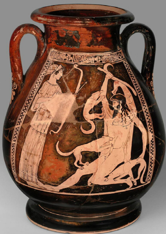
Άρτεμη και Ακταίων (που κατασπαράζεται από σκυλιά). Ερυθρόμορφη πελίκη, Ζωγράφος του Γήρατος, περ. 480-470 π.Χ. Παρίσι, Μουσείο Λούβρου.

Στο αγγείο που υπάρχει παρακάτω η μια όψη εικονίζει τον φορικό θάνατο του Ακταίωνα και η άλλη όψη μια ήρεμη και τρυφερή σκηνή μεταξύ του Δία και του Γανυμήδη. Να τοποθετήσετε λεξάντα στην κάθε όψη του αγγείου, χρησιμοποιώντας λέξεις από στίχους του Β' Στάσιμου.